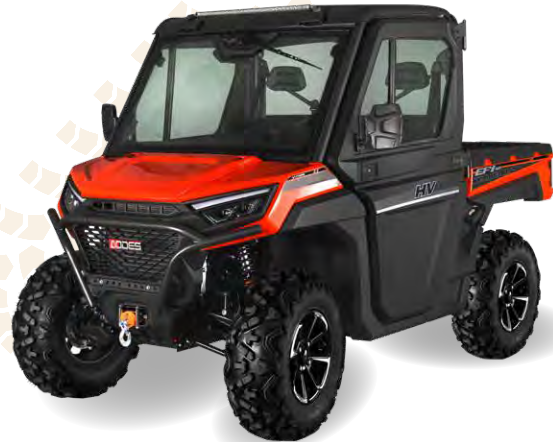
Kuvan Workcross 650 Pro -mallissa on vakiona mm. etupuskuri, LED -valopaneli, radio ja peruutuskamera.